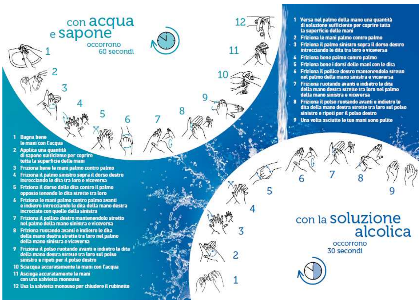
Riferimento 1 – ALLEGATO 4

Per le tecniche di dettaglio “ Lavaggio delle mani ” si rimanda alle infografiche “ Riferimento 1 e 2 dell'ALLEGATO 4 ”. Di seguito si riportano le rappresentazioni infografica in formato ridotto: